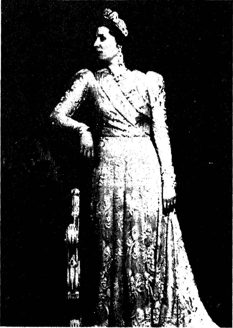
الملكة نازلي في الثوب الملكي الرسمي . . صورة ألتقطت لها في عهد ابنها فاروق وبعد رحيل زوجها الملك فؤاد .